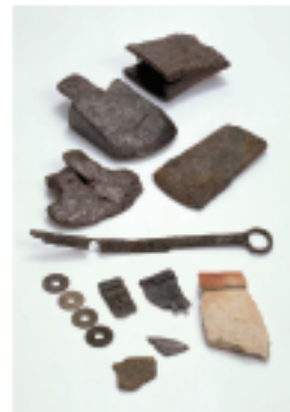
大陸からもたらされた遺物の数々