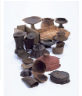
【鳥取県埋蔵文化財センター提供】